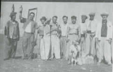
Quetrequén Galponeros y bolseros C. 1940