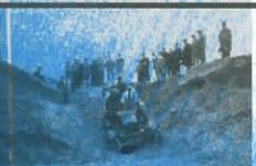
General Pico Prueba de automóvil C. 1915