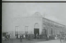
Santa Rosa Almacén "El Sol" 1902