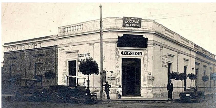
Agencia del FORD de Del Valle en Sarmiento y Avellaneda, 1917.

10%. Tal circunstancia se explica por la guerra de 1914 y sus desastrosas consecuencias económicas, y si bien el capital en giro aparece casi triplicando en 1920 con relación a 1912, ello debe atribuirse no solamente al mayor consumo - con su correlativo aumento de ventas y crecimiento del volumen de los negocios comerciales- , sino también, y en grado muy considerable, al mayor valor que hoy tienen las mercaderías con respecto a 1912, que, en general, es aproximadamente el doble en el territorio" (Censo, 1923, s/p). Para cerrar este breve panorama del mundo comercial, otros registros indican que a partir de estos años se produjo un importante aumento. En primer lugar, las sociedades comerciales protocolizadas a partir de 1920 aumentaron considerablemente, concentrando por sí sólo este período casi el 50% del total. Dentro de los rubros que presentaban mayor dinamismo estaban los tradicionales, como almacenes, ferreterías y una gama muy amplia de locales dedicados a la provisión de alimentos y de servicios. Pero, además, surgieron otros negocios que, por cierto, demuestran la diversificación de las actividades comerciales, como fue la instalación de agencias de automóviles. En segundo término, el censo de 1942 (citado por Stieben, 1946, p. 278) ratifica que el número de establecimientos en el Segundo Departamento llegaba a 310, lo que representaba un incremento sustancial.